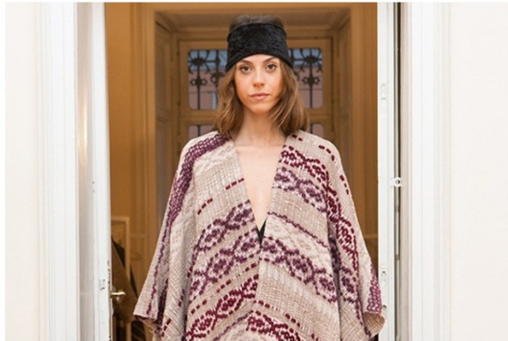
「CANGIARI」がミラノで発表した2017年秋冬コレクション。